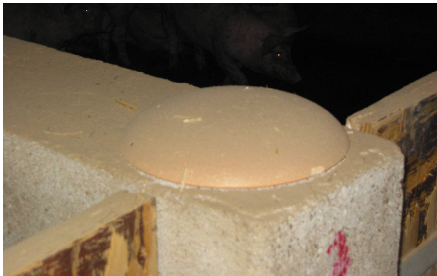
Le Réharmoniseur posé sur le passage de la veine d'eau

Dans une salle où se trouve un passage d'eau souterrain, j'ai mis en place un Réharmoniseur et j'ai constaté que les porcs étaient plus calmes et profitaient mieux des compléments alimentaires Plocher.