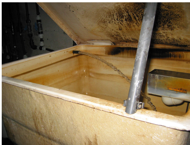
Les 1000 litres sont envoyés par une pompe dans l'eau de boisson distribuée dans les 3 salles. L'eau non consommée revient dans le bac.