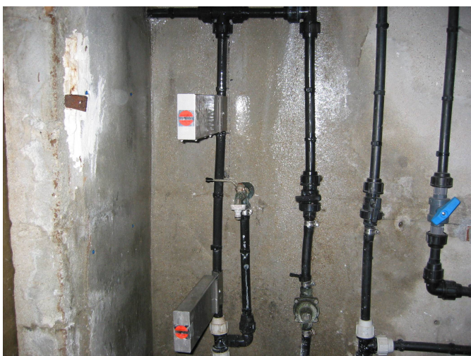
L'eau d'arrivée est traitée par 2 PlocherKat.