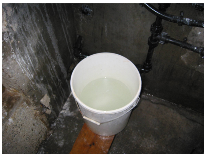
Le mélange est préparé 24 heures à l'avance, le seau est posé sur une planche en bois.

Tous ces produits sont mélangés dans un seau 24 heures à l'avance, puis je répartis ce mélange dans un bac de 1000 litres. Ce bac est équipé de deux flotteurs : un en haut et un en bas du bac. Celui du haut coupe l'arrivée d'eau quand le bac est plein. Celui du bas assure un niveau minimum d'eau dans le fond du bac.